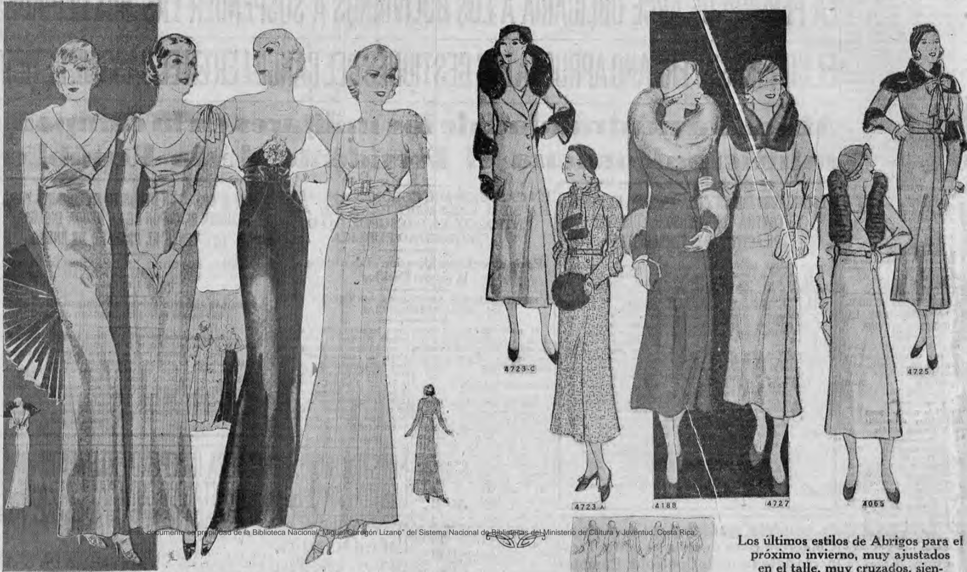
TELAS QUE SE NECESITARAN PARA ESTOS TRAJES: Charmeuse, Terciopelo y los nuevos crespones CORRUGADOS, de una novedad de última hora en París y de elegancia exquisita.

LOS TRES DETALLES EN QUE CONSISTIRA LA ELEGANCIA ESTE INVIERNO: TALLE ALTO, COSTADOS LISOS, BUSTO PRONUNCIADO